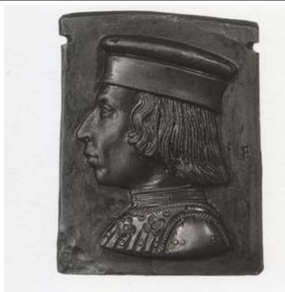
Илл.6. Антонио Марескотти (активен в 1444 – 1462 гг.). Портрет Джулио Чезаре Варано.