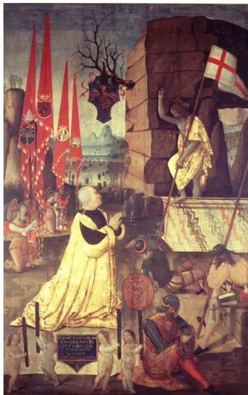
Илл.10. Пържените да Мателика, Венанцио да Камерино. Воскресший Христос, молящийся Джулио Чезаре Варано и четыре ангела, держащие знамена со знаками его синьоров. Рим, Палаццо Ланчиллотти