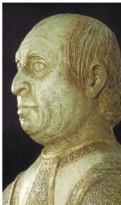
Илл.7. Мраморный бюст Джулио Чезаре Варано, украшавший ворота его дворца. Конец 15 в.