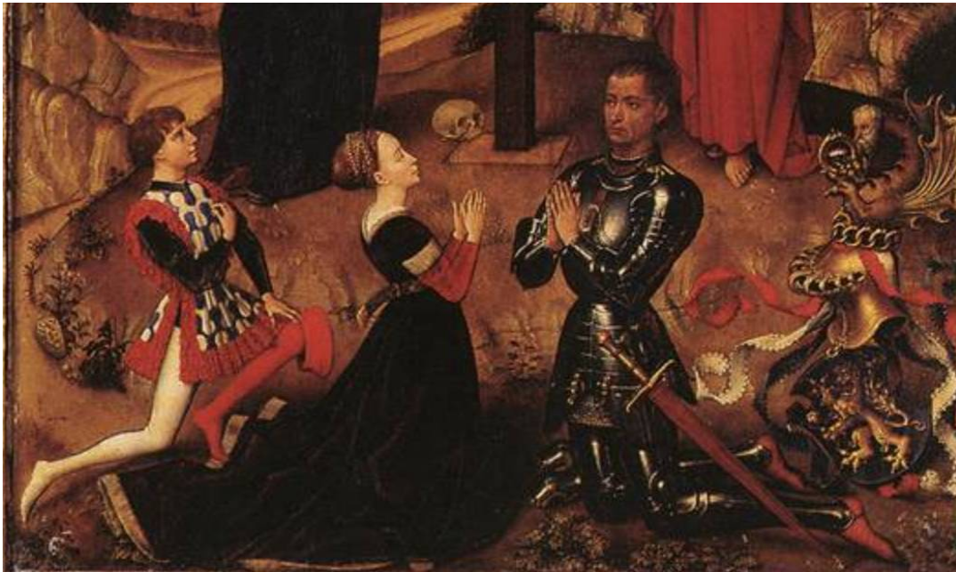
Илл.3. Рогир ван дер Вейден. Алтарь Сфорца. Ок. 1460 г. Королевский музей изящных искусств, Брюссель. Справа – Алессандро Сфорца, слева – его жена Костанца и её брат Ридольфо Варано.