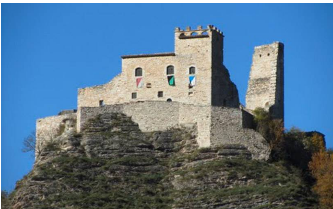
Илл.1. Рокка ди Варано – родовая крепость семьи Варано.