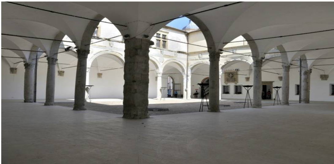
Илл.8. Внутренний двор дворца Варано в Камерино.