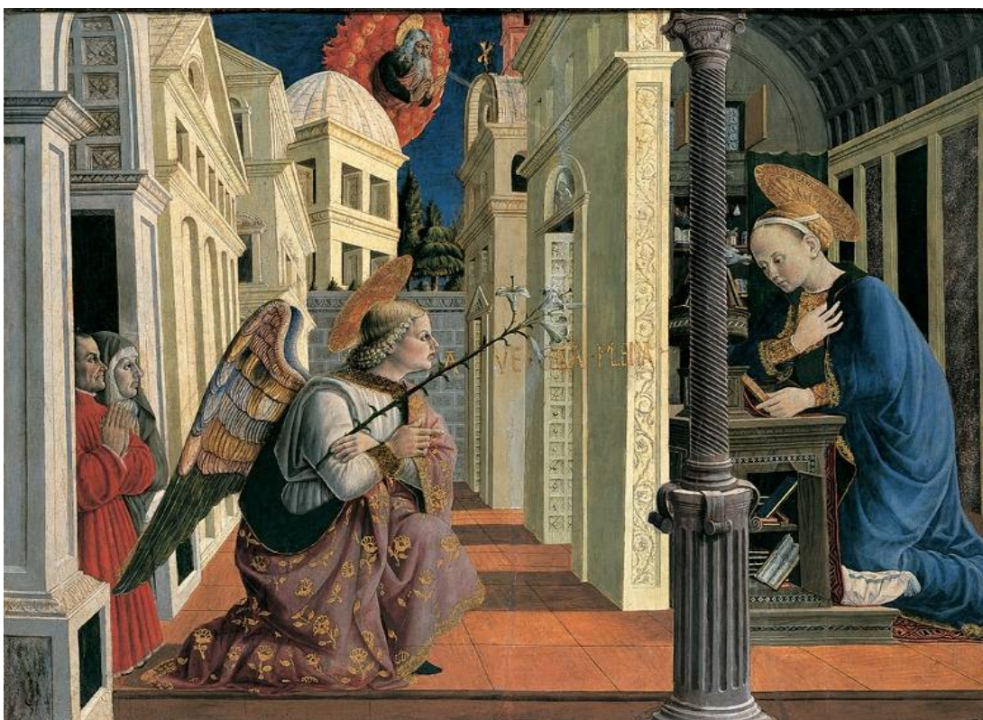
Илл.2. Джованни Анжело д'Антонио. Благовещение и оплакивание Христа (деталь).1455. Картинная галерея Камерино.