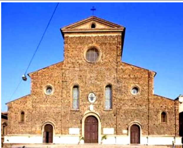
Илл.11. Собор в Фаянцы.