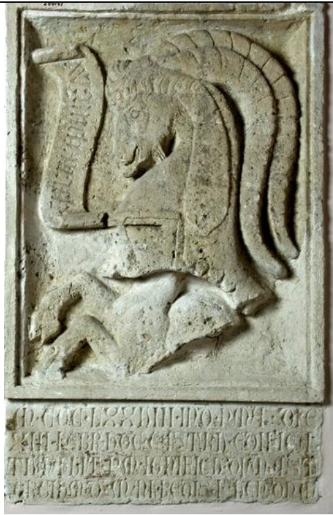
Илл.1. Герб Асторджо I Манфреди. 109x68. Пинакотека г. Фаннца.