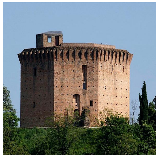
Илл.12. Башня в Ориоло.