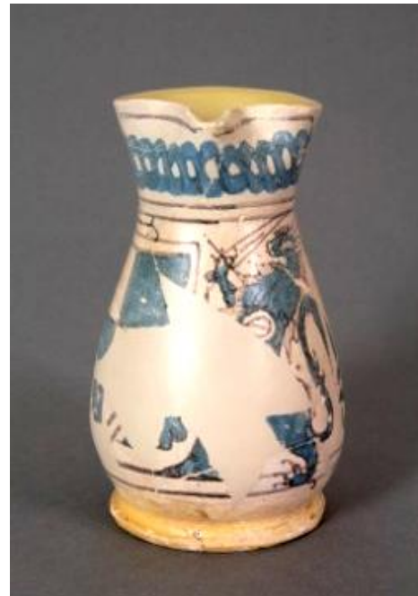
Илл.4. Бокал. 1390-1399. Высота 21,2 см. Интернациональный музей керамики г. Фаннца.