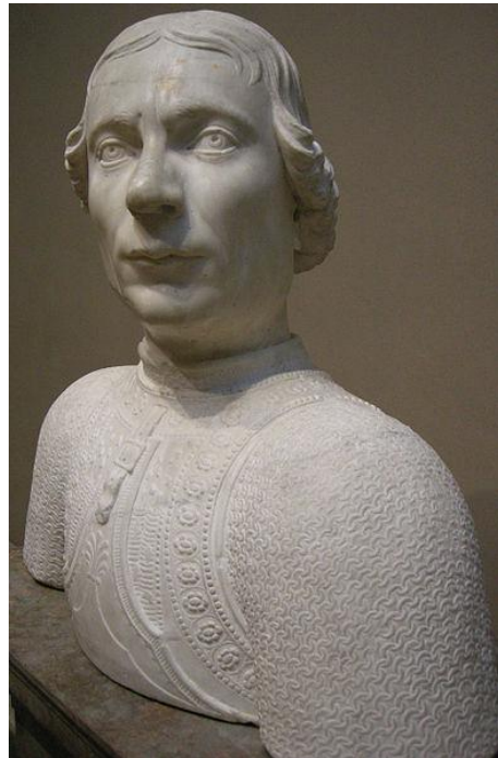
Илл.8. Мино да Фьезоле. Портрет Асторджо II Манфреди. Национальная галерея искусств. Вашингтон.