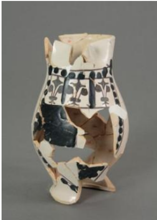
Илл.7. Бокал. 1400-1449. Высота 18,2 Интернациональный музей керамики г. Фаэнца.