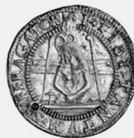
Илл.17. Монеты Фаэнцы времён правления Манфреди.