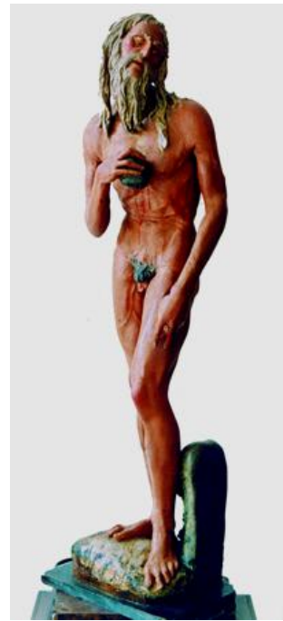
Илл.10. Донателло. Св.Иероним. Ок.1454.