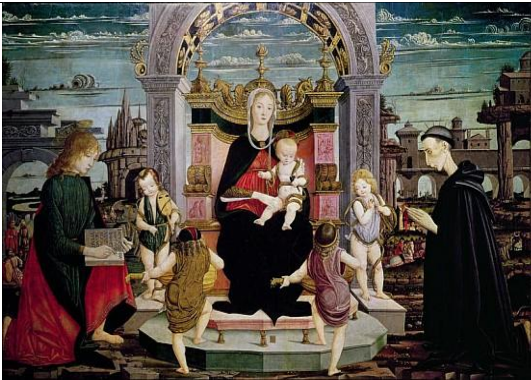
Илл.13. Леонардо Скалетти. Мадонна на троне со св. Иоанном Крестителем и блаженным Бертони. Пинакотeka г. Фаэнцы.