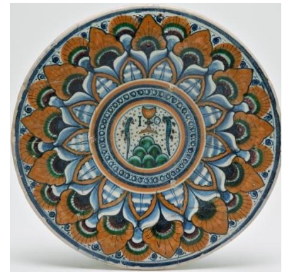
Илл.15. Тарелка с «павлиньим» узором и символами рода Манфреди в центре. 1475 – 1499.

Интернациональный музей керамики г. Фаэнца.