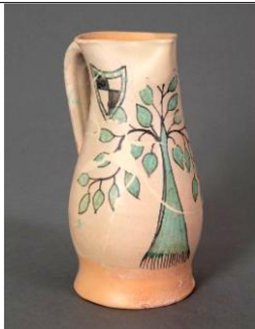
Илл.6. Бокал. 1390-1399. Высота 24,2 см. Интернациональный музей керамики г. Фаэнца.