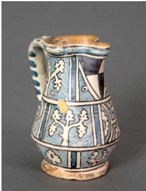
Илл.3. Бокал. 1375-1399. Высота 18,4 см. Интернациональный музей керамики г. Фаннца.