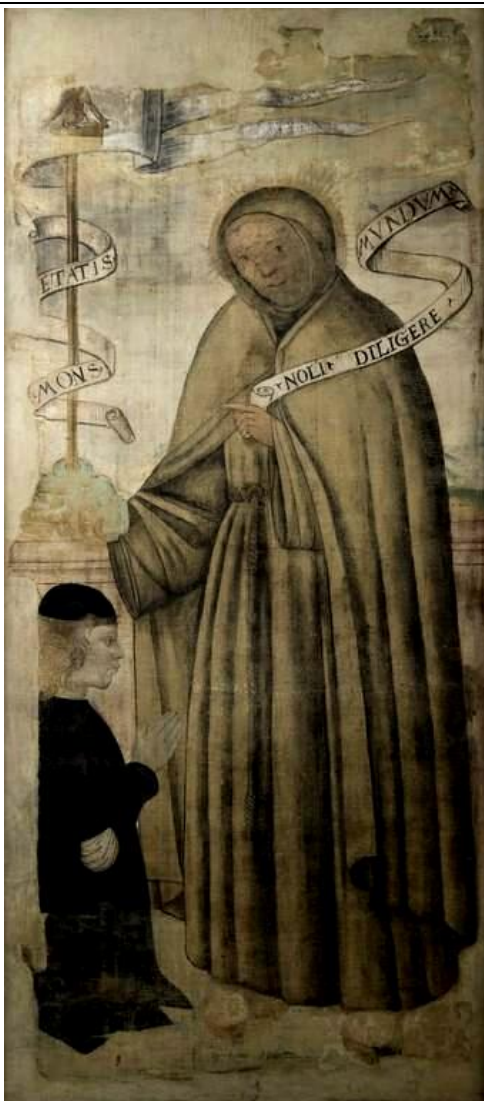
Илл.16. Асторжо III Манфреди и св. Бернадино да Фелтре.