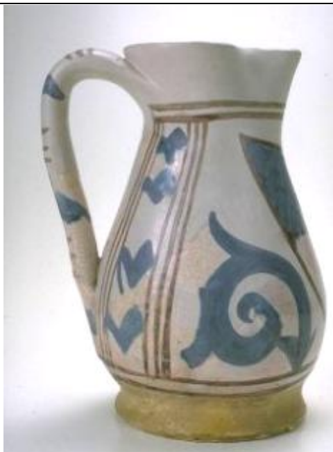
Илл.5. Бокал. 1390-1399. Высота 18,2 см. Интернациональный музей керамики г. Фаэнца.