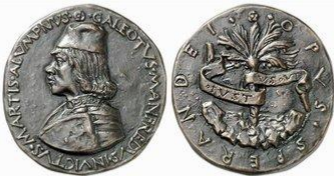
Илл.14. Сперандио Савелли. Портрет Галеотто Манфреди. Частное собрание.