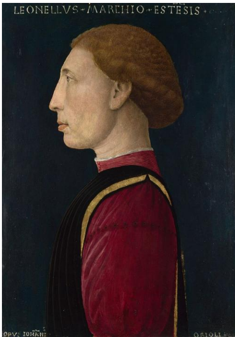
Илл.9 Джованни да Ориоло. Портрет Леонелло д'Эсте. 1447. Лондонская национальная галерея.